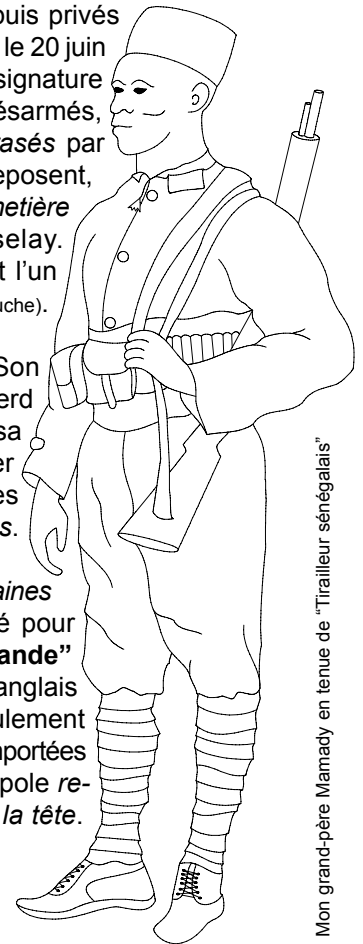
Mon grand-père Mamady en tenue de "Tirailleur sénégalais"

Plus Loïn : "Les tirailleurs sénégalais" vidéo - SEDOUY - 1991 "Les combattants africains ..." vidéo - DUSSAUX - 1984 "Les tirailleurs d'ailleurs" vidéo - IVANGA "Soldats noirs (L'histoire oubliée)" vidéo - DEROO